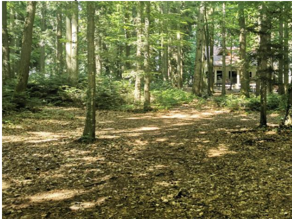
Pozicija odmorišta 4. Lovački dom