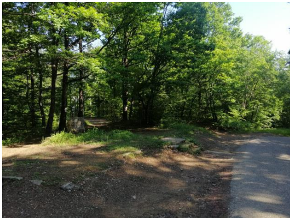
Pozicija odmorišta 1. – polazišna točka